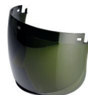
Osłony twarzy serii 5