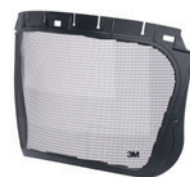
Osłony twarzy serii 5