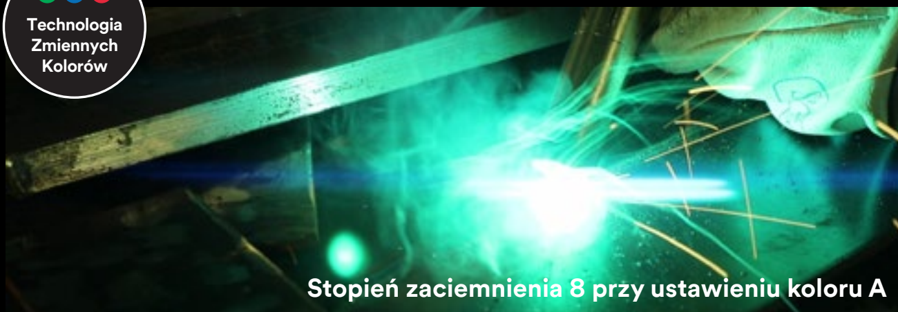
Stopień zaciemnienia 8 przy ustawieniu koloru A