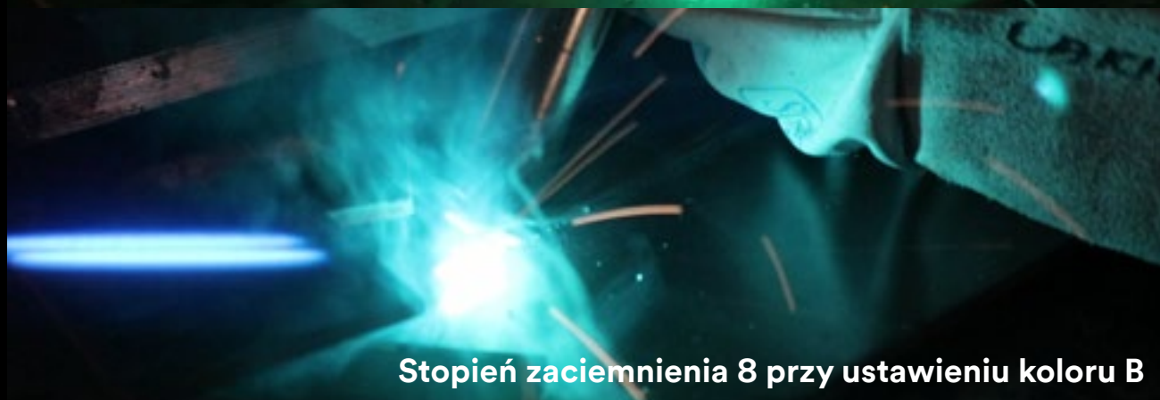
Stopień zaciemnienia 8 przy ustawieniu koloru B