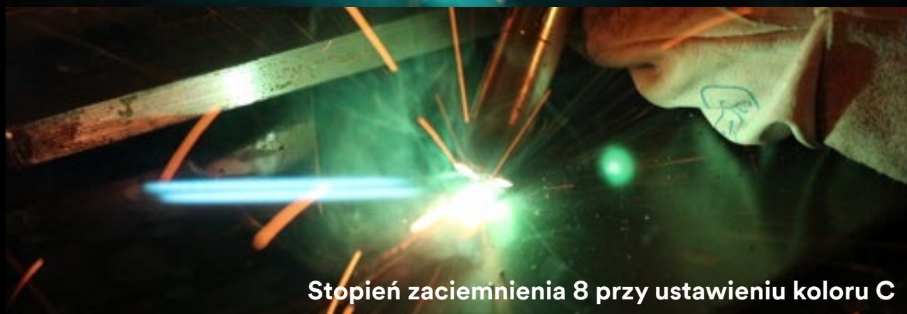
Stopień zaciemnienia 8 przy ustawieniu koloru C

Filtr spawalniczy 3M™ Speedglas™ G5-01VC