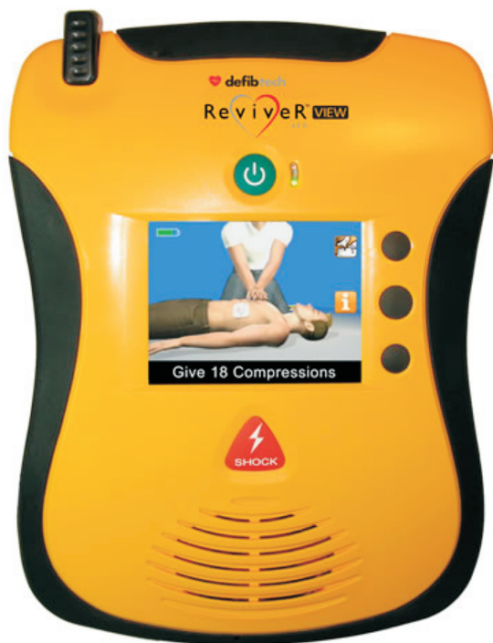
DEFIBRYLATOR LIFELINE VIEW AED