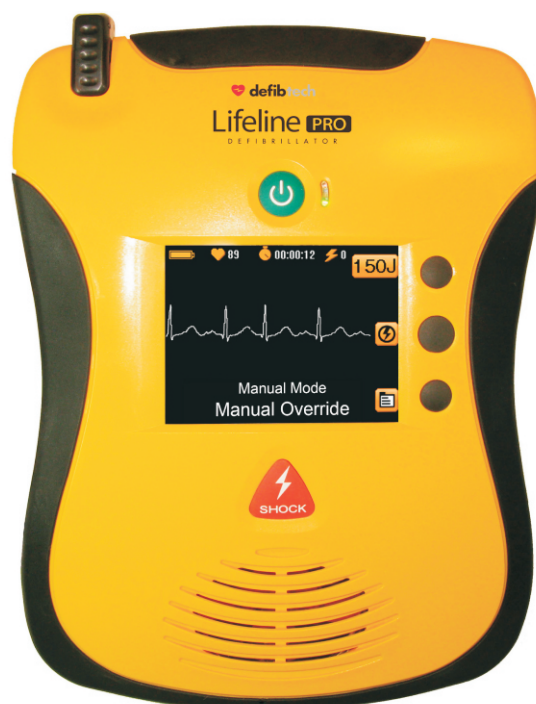
DEFIBRYLATOR LIFELINE PRO AED