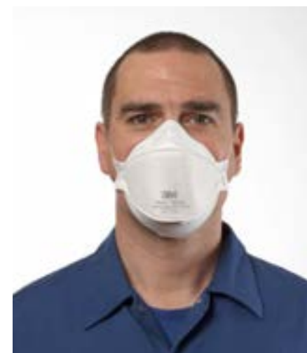
Półmaska filtrująca 3M™ Aura™ 9310+