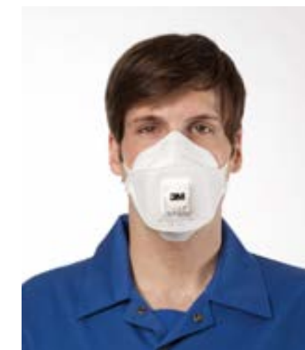
Półmaska filtrująca 3M™ Aura™ 9312+

Półmaska filtrująca 3M™ Aura™ 9320+ Klasyfikacja: EN 149:2001+A1:2009 FFP2 NR D. Ochrona: pyły/mgły. Maksymalny poziom ochrony: do 12 x NDS.