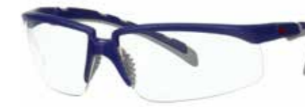
S2001AF-BLU Soczewki: Bezbarwne | Kolor oprawki: Niebiesko/szara