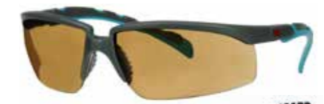
S2005SGAF-BGR Soczewki Brązowe | Kolor oprawki: Szaro/niebiesko-zielona