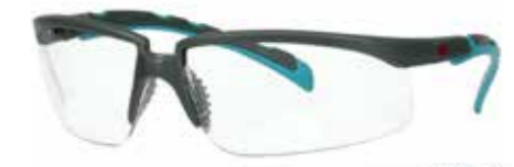
S2001SGAF-BGR Soczewki: Bezbarwne | Kolor oprawki: Szaro/niebiesko-zielona