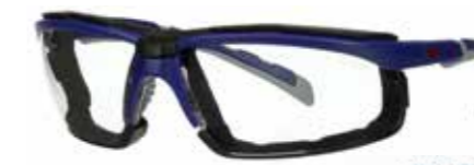
Piankowa uszczelka S2001SGAF-BGR-F Soczewki: Bezbarwne | Kolor oprawki: Szare/niebiesko-zielona

Modele okularów do czytania i z ochroną przed promieniowaniem podczerwym będą dostępne pod koniec 2019 r.