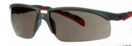
S2002SGAF-RED Soczewki: Szare | Kolor oprawki: Szaro/czerwona