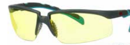
S2003SGAF-BGR Soczewki: Żółte | Kolor oprawki: Szaro/niebiesko-zielona