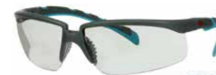
S2007SGAF-BGR Soczewki: I/O szare | Kolor oprawki: Szaro/niebiesko-zielona