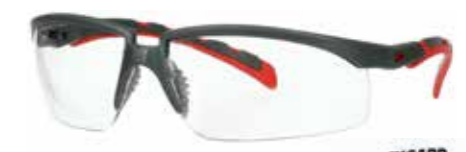
S2001SGAF-RED Soczewki: Bezbarwne | Kolor oprawki: Szaro/czerwona