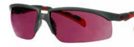
S2024AS-RED Soczewki: Czerwone lustrzane | Kolor oprawki: Szaro/czerwona