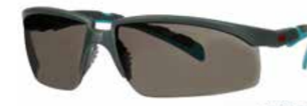
S2002SGAF-BGR Soczewki: Szare | Kolor oprawki: Szaro/niebiesko-zielona