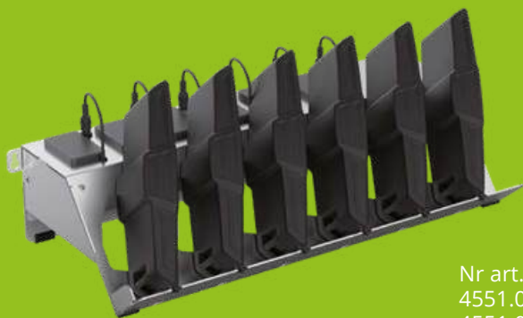
Nr art. 4551.015.CH, 4551.016.EU, 4551.017.UK, 4551.018.US Ładowarka wieloportowa serii e3000