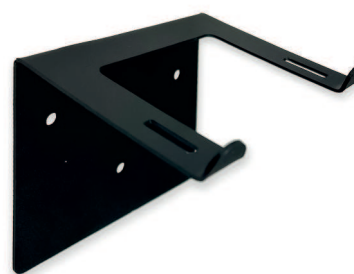
SKU: TKS454 TRAUMAKIT Mini – Uchwyt ścienny 4