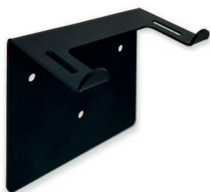
SKU: TKS455 TRAUMAKIT Mini – Uchwyt ścienny 2