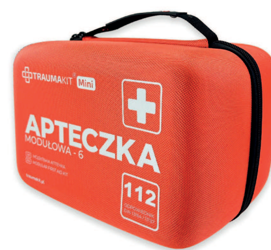
SKU: TKS446 TRAUMAKIT Mini - Torba 6 (bez wyposażenia)