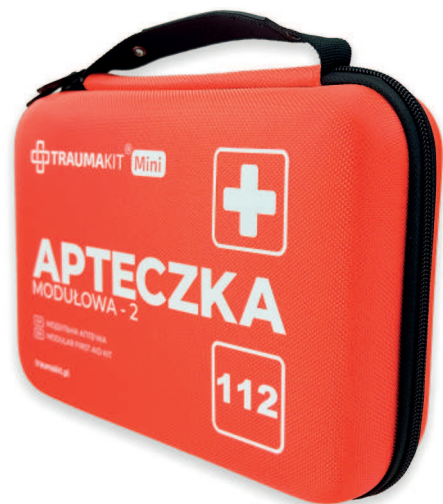
SKU: TKS444 TRAUMAKIT Mini - Torba 2 (bez wyposażenia)