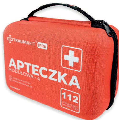
SKU: TKS445 TRAUMAKIT Mini - Torba 4 (bez wyposażenia)